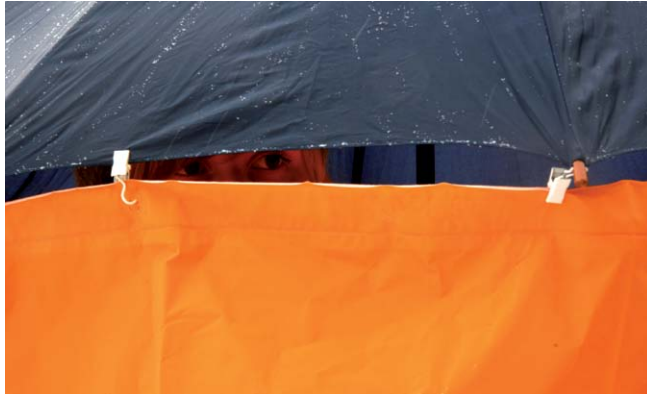
Asta Nykänen Private Space - Public Space Detail