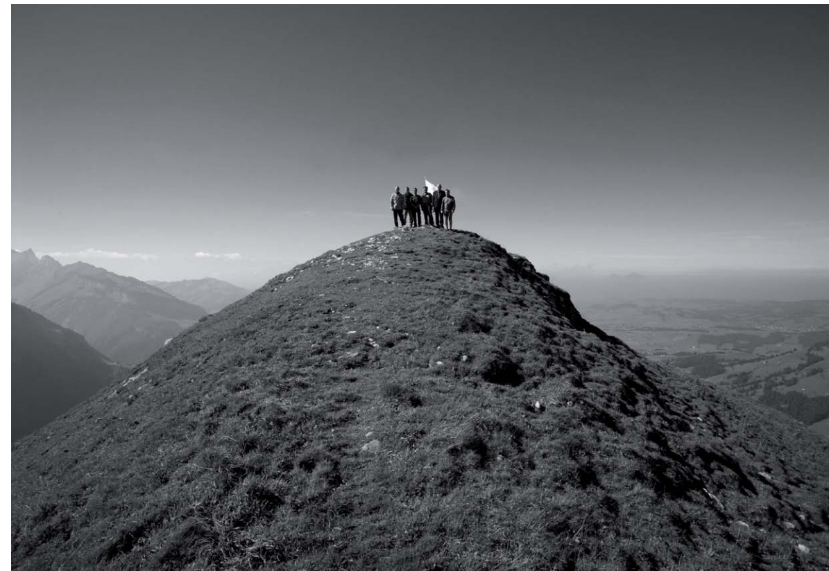
Das kleinste Gipfeltreffen der Welt Die sechs Gemeindepräsidenten der kleinsten politischen Gemeinden Mitteleuropas 2004

Diese sechs kleinsten Allianzen haben durch das Projekt auf einmal Popularität erlangt. Das Projekt wurde nicht nur in der Kunstszene wahrgenommen, sondern auch im politischen Zusammenhang: Was bedeutet das, wenn sich Kleine mit einem Mal zusammentun? Darf man das überhaupt, sich oben auf